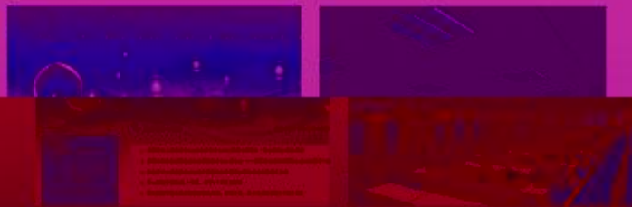
图 5-1-1 工程实践创新项目